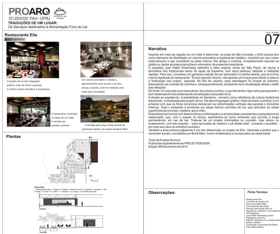
Figura 2 – Exemplo de ficha de catalogação dos projetos publicados, ou seja, das traduções do projeto/ambiente.