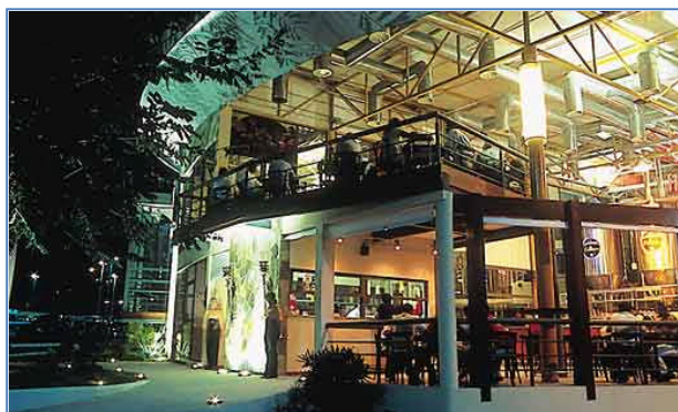
Figura 1 – Restaurante Fellice, Manaus.

“O ponto de partida foi estabelecer uma referência tipológica com os mosteiros alemães do século XII , onde a cerveja começou a ser produzida em escala industrial. Os arquitetos optaram pela estrutura mista e ergueram uma construção simples , formada por três blocos.” (PROJETO DESIGN 2003) - sobre o Restaurante Fellice, Manaus. Fonte: (ARCOWEB,2003 – grifo nosso)