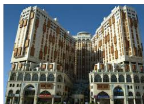
Fig. 6c – Hilton Makkah