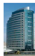
Fig. 6d – Hilton Durban