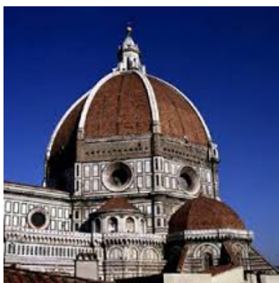
Fig. 1 – Domo Catedral de Florença

De certa forma, retoma-se o entendimento medieval de modelar a realidade como uma questão em aberto, como descreve Paul Walker sobre o processo de construção da Cúpula da Catedral de Florença (Fig. 1)