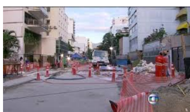
Fig. 7b – Rua Barão da Torre