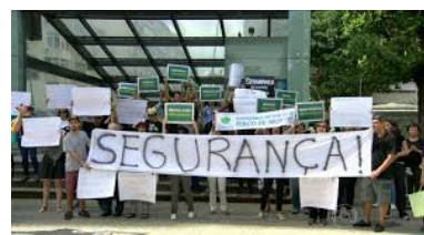
Fig. 7c – Manifestação de Moradores

Os cálculos e análises teóricos não foram suficientes. Alguns operários adoeciam devido aos efeitos de vazamentos de água, esgoto e gás. Outros corriam riscos de acidentes como desabamentos, inundações e choques elétricos (Figs. 7b e 7c). Não tenho informação sobre a morte de algum operário ou morador, mas muitos deles tiveram que temporariamente se mudar ou passaram mal.