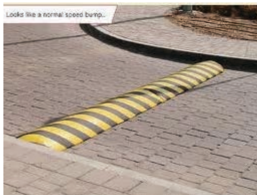
Fig. 4 – Quebra-molas

Um quebra-molas (Fig. 4) é um dispositivo cuja concepção e materialização mobiliza um conjunto de pessoas de diferentes formações – engenheiros de tráfego, designers, calculistas ou engenheiros e técnicos em eletrônica, programadores visuais, operários e engenheiros civis, o material para a confecção e instalação do quebra-molas ou pardal, material para sinalização, fiscais da prefeitura, guardas de trânsito ou um sistema eletrônico de monitoramento, veículos, motoristas, pedestres. Diante de um quebra-molas ou de um pardal instalado perto de uma escola, quem age? O motorista, que decide reduzir a velocidade, ou é o quebra-molas que "provoca" o motorista a agir?