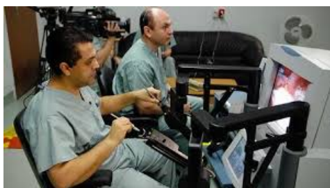
Fif 2a – Operação remota

Em lugar de intocada e vista por diversos olhos, a "realidade é manipulada por meio de vários instrumentos, no curso de uma série de diferentes práticas" (Mol 2008: 66): pode ser cortada por um bisturi; bombardeada com ultra-sons; pesada em uma balança, operada à distância e remotamente, visualizada por dispositivos tecnológicos – de geo-referenciamento, de manipulação gráfica digital e de inclusão da dimensão paramétrica; scanners, técnicas de avivar cores, dispositivos e de vigilância, câmeras de filmagem capazes de mapear cidades, regiões, hemisférios na Terra ou em outro lugar do sistema solar (Haraway 2012) (Figs. 2a, 2b, 2c.).