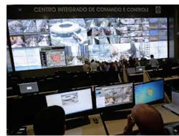
Fig 2c – Centro de Controle