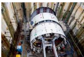
Fig. 7a – Tatu

Assim que o Tatu começou a perfurar, os responsáveis pela obra tiveram que "virar a página ... ir para outros lugares ...que estavam fora da página " (Law, Mol 2000: 8) e procurar outras conexões além das que estavam previstas nas folhas de papel do projeto. Apesar de todos os cuidados, o trabalho de perfuração não funcionou conforme o previsto, recrutou outros atores – tais como grandes crateras que dificultaram o acesso de moradores e veículos a determinados edifícios, reavaliação dos riscos de desabamento, interrupções não previstas no fornecimento de água, gás e de energia, contratação de obras de reforço e reparo dos danos provocados, reavaliação dos riscos dos operários, técnicos e equipamentos que operavam no subsolo e, pior, interrupção da perfuração.