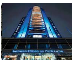
Fig. 6b – Hilton Londres