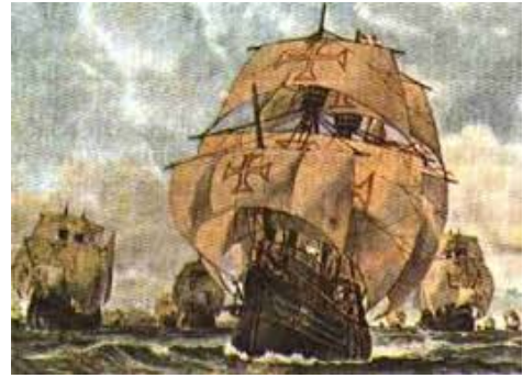
Fig. 5b Caravelas de Pedro Álvares Cabral

Um objeto de rede implica também uma forma estável dentro de um espaço de rede. Os dois vão juntos. Espacialidade é um aspecto da estabilidade da rede . Uma grande rede (com seus ventos, suas estrelas, seus comerciantes e os seus príncipes) [p. 4] implica um espaço de rede que torna possível a mobilidade imutável de um objeto - como um navio Português viajando de Lisboa para Calicut (Law, Mol 2000: 4-5).