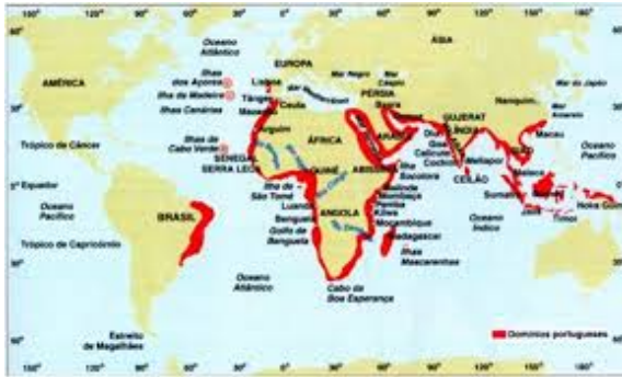
Fig. 5a – Mapa do Império Português