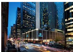
Fig. 6a – Hilton NYC

Diferentemente de uma rede sociotécnica, que vem com invariância configuracional, o Hotel "X" mostra variação das configurações. É um móvel mutável . Ele é ao mesmo tempo o 'mesmo objeto' e um 'objeto diferente' em dois lugares. Esta sua característica variável na forma e no conteúdo é que permite que ele se 'mova' (assim funciona o argumento) para tantos lugares no mundo embora não seja uma forma invariável na rede sociotécnica ou no espaço euclidiano.