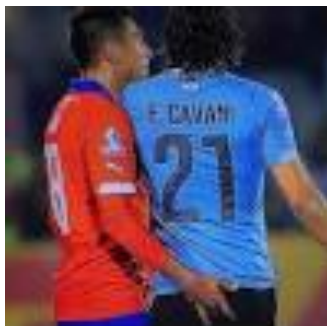
Fig. 3 – Jara e Cavani Copa América 2015

O crescente uso de playback de vídeo de lances duvidosos nas competições esportivas, registra cada lance de diferentes pontos de vista permite rever [in]decisões. Foram esses dispositivos que confirmaram que o juiz do jogo Uruguay e Chile errou ao dar o cartão vermelho para o jogador Cavani. Há quem defenda que Jara é que deveria ter sido expulso por atitude antidesportiva (Fig. 3)