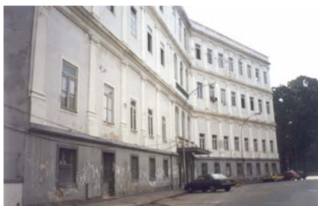
Fig. 1 – edifício da FND – dias atuais

Em 1983, a edificação adquire oficialmente a categoria de monumento histórico através do tombamento estadual (processo nºE – 03/31267/83) pelo INEPAC (Instituto Estadual do Patrimônio Artístico e Cultural).