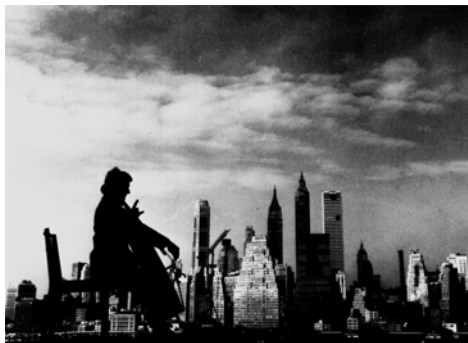
Fig. 2 – Maurice Baquet Performs before Manhattan